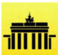
Landesfrauenrat Berlin e. V.